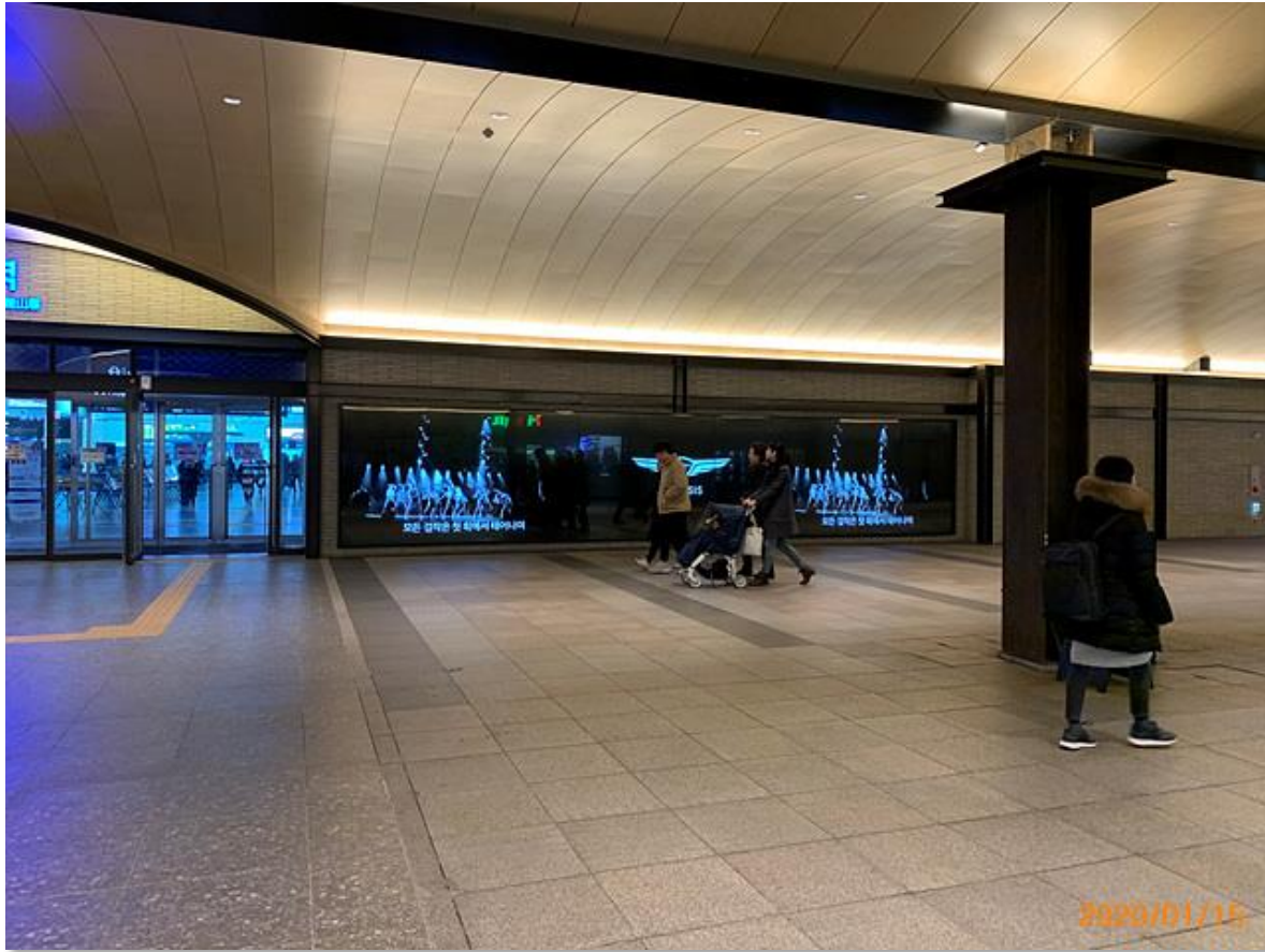
아이파크몰~용산역 출입구 media wall