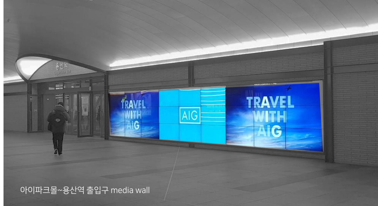
아이파크몰~용산역 출입구 media wall