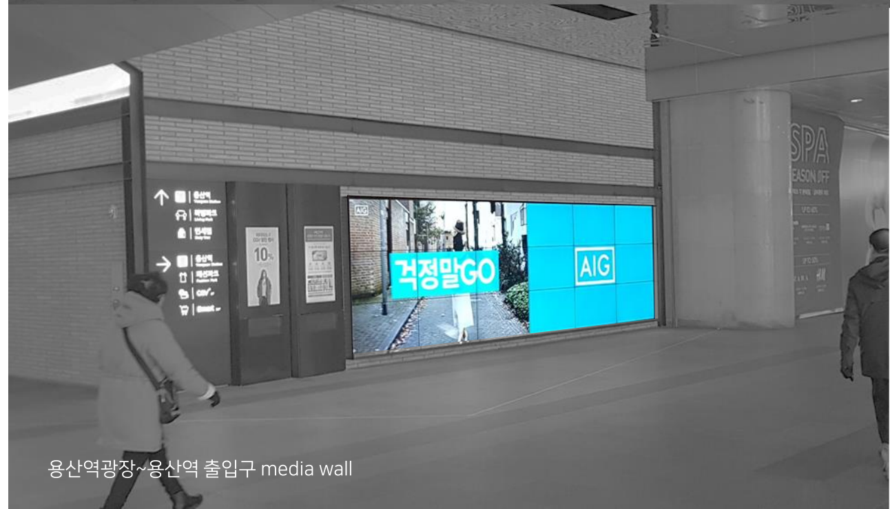
용산역광장~용산역 출입구 media wall